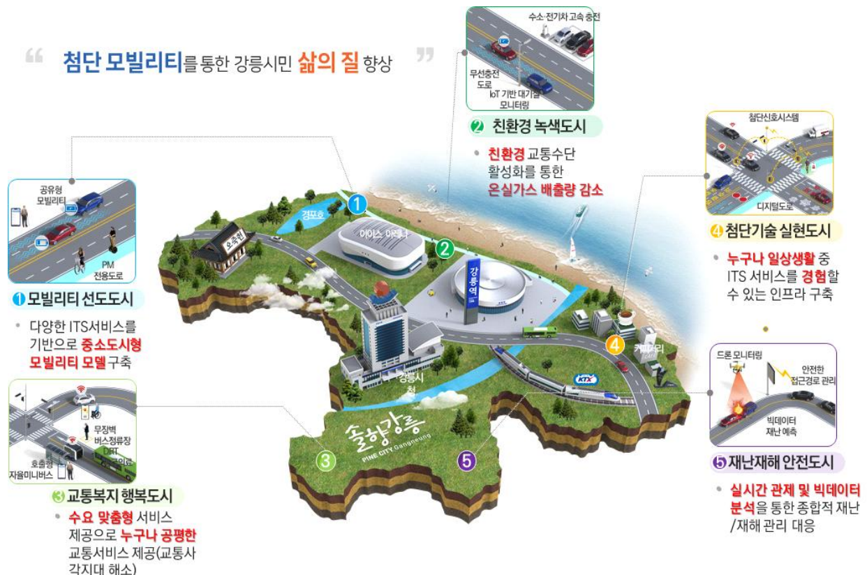
<강릉시 ITS 기본계획 비전 및 목표>