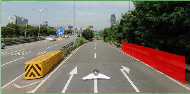
올림픽대로(공항방향) 여의상류IC 진출램프 우측