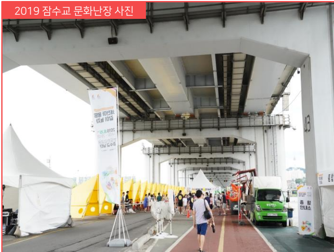
2019 잠수교 문화난장 사진

잠수교(약 1.1km)통제 ※잠수교 남단 회전교차로 정상 운영(올림픽대로, 세빛섬 접근 가능) (차량) 10시~23시 통제 (버스) 전일통제 (405번, 740번) 반포대교 임시우회 운영