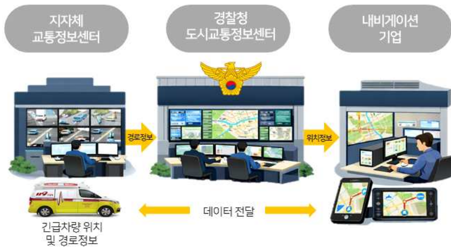
긴급자동차 접근 정보 길도우미(내비게이션) 연계 서비스 정보 제공 흐름도

또한, 앞으로는 반대 방향 등 긴급자동차가 통행하는 인근 자동차의 길도우미에도 긴급자동차 출동 정보를 안내할 수 있도록 하는 등 서비스 고도화를 추진할 예정이다.