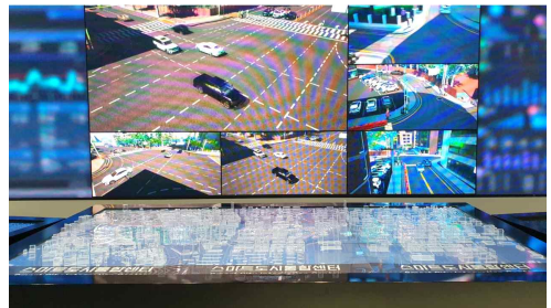
디오라마, 스마트도로 체험