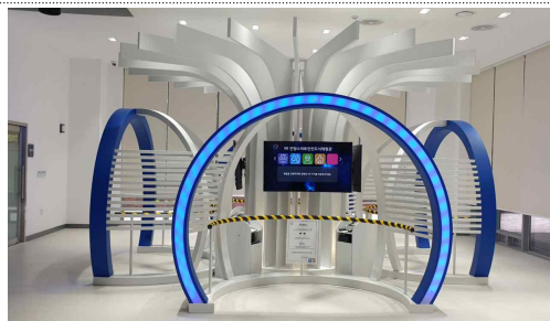
VR-XR 가상현실 체험