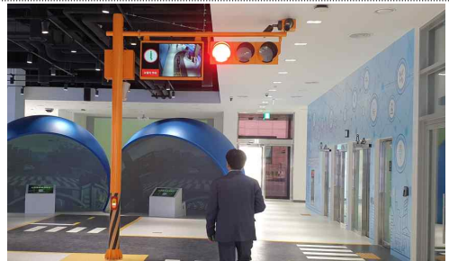
스마트도로 및 스마트 스쿨존