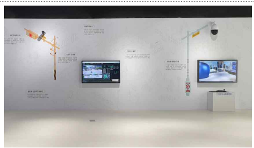
AI CCTV 체험