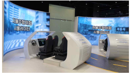
자율주행 시뮬레이터 체험