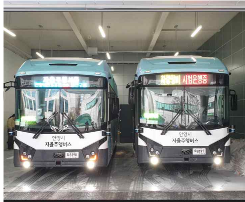
자율주행버스 탑승 체험