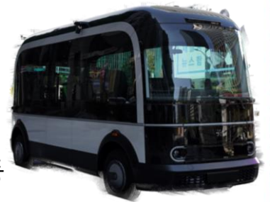
청계천 자율주행버스 노선도

총 8시간 동안 다양한 자율주행자동차에 대한 교육 실시 자율자동차 기술 및 미래교통변화 자율자동차 탑승객을 위한 친절서비스 도로교통법 등 관련 법령의 이해 자율자동차 안전운행요령 및 사고분석 등