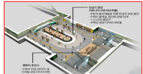
수락뜰 공간 안내

넓은 커뮤니티 라운지와 18개의 멀티비전 설치 산을 나타내는 아트월 과 수락(水落)을 표현한 폭포 영상