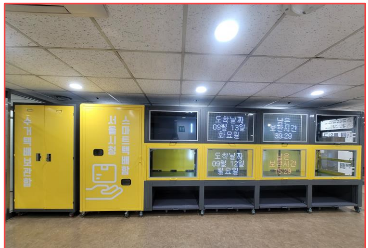
스마트 택배함 설치 현황