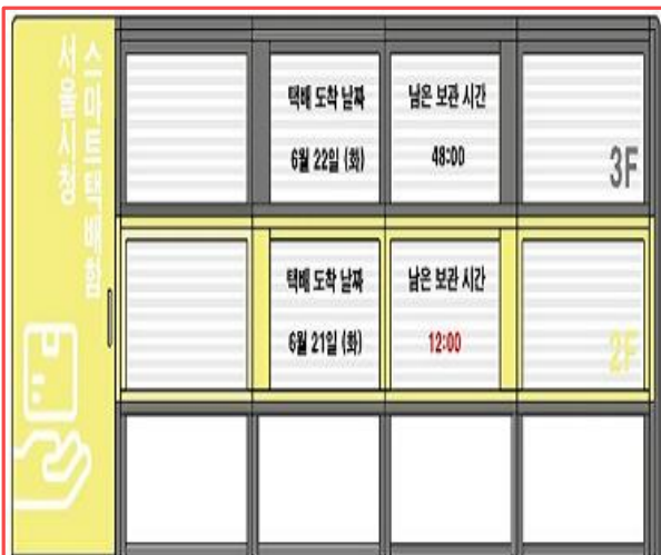
스마트 택배함 디자인