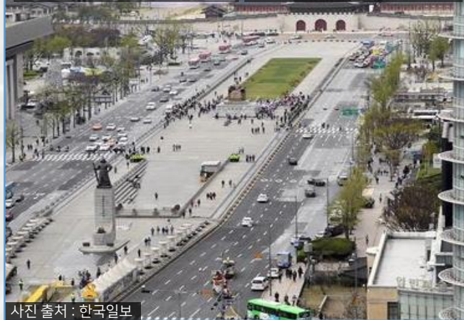
왕복 9~12차로 왕복 7~9차로

세종로 확장공사 2회(1966년, 1970년) 광화문 복원 및 이순신 장군 동상 설치(1968년)