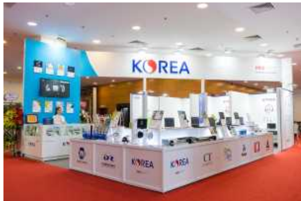
[ 오픈부스 공동관 ]