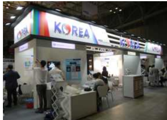
[ 개별부스 공동관 ]