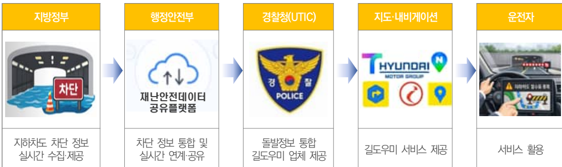
지하차도 차단 정보 안내 서비스 운영 체계

이번 서비스 제공을 위해 경찰청(한국도로교통공단)과 행정안전부, 지방정부, 그리고 민간 길도우미(내비게이션) 업체가 함께 협력한다. 지하차도가 침수되면 지방정부는 현장 통제를 함과 동시에 행정안전부의 '재난안전데이터 공유플랫폼'에 통제 정보를 전송하고, 이 정보가 경찰청을 거쳐 길도우미(내비게이션) 앱에 실시간 반영되는 방식이다.